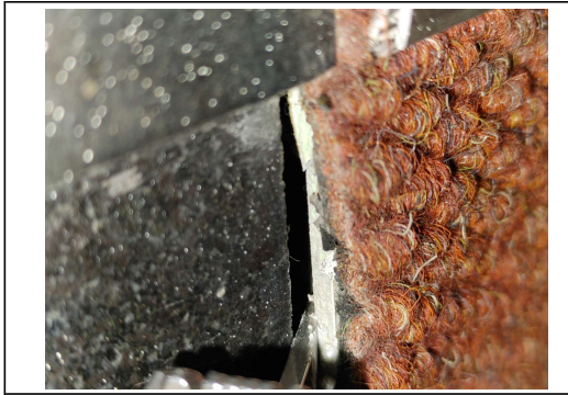
계단 카펫 안쪽